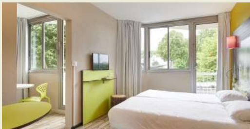
• Chambre salon 25 m 2